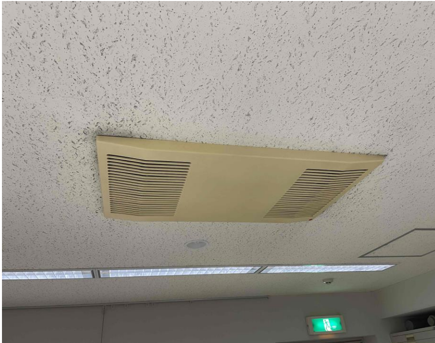
水熱源ヒートポンプユニット