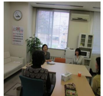
(がん相談サロンの様子)